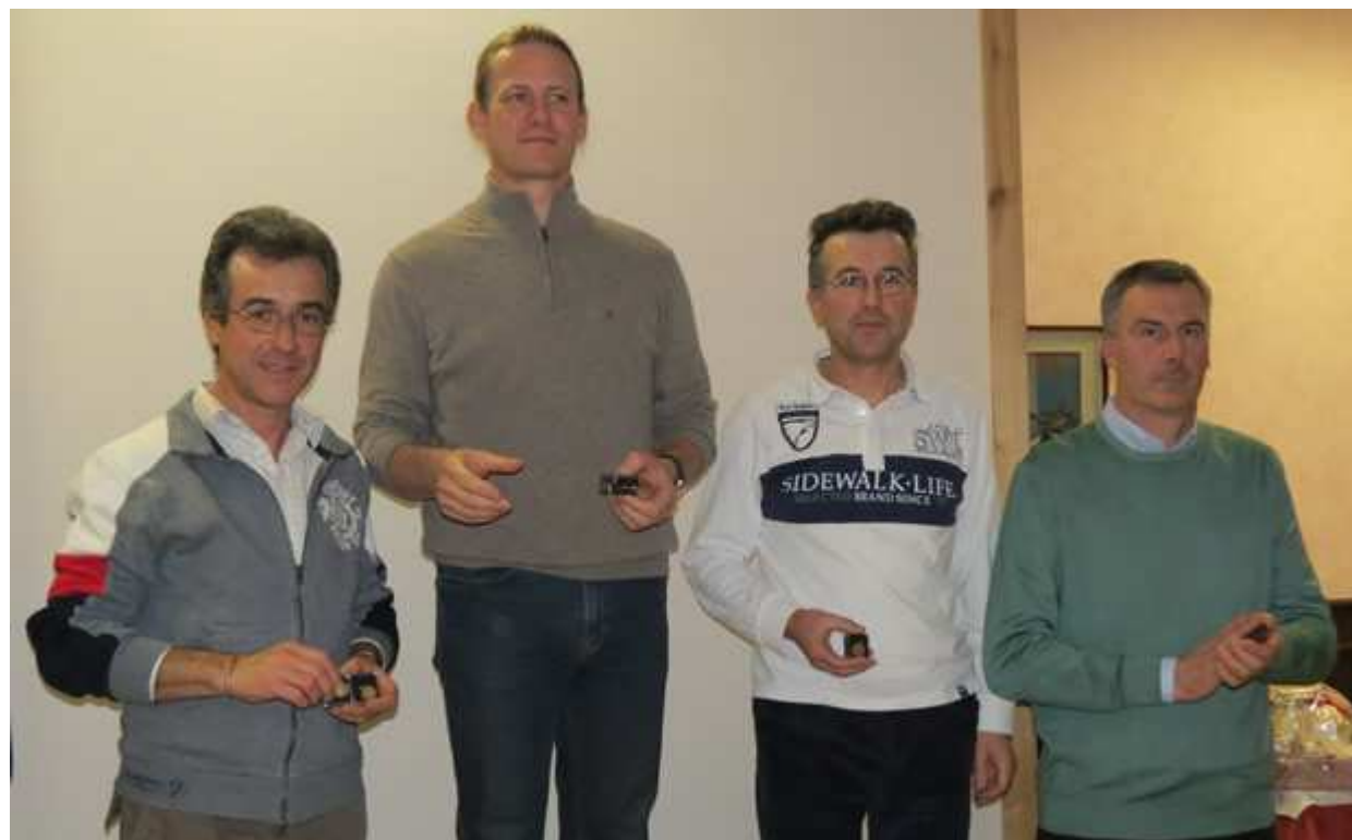
Il podio della gara tra natanti