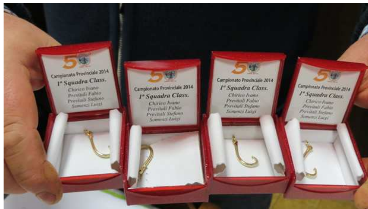
Gli amini d'oro consegnati ai vincitori del campionato provinciale