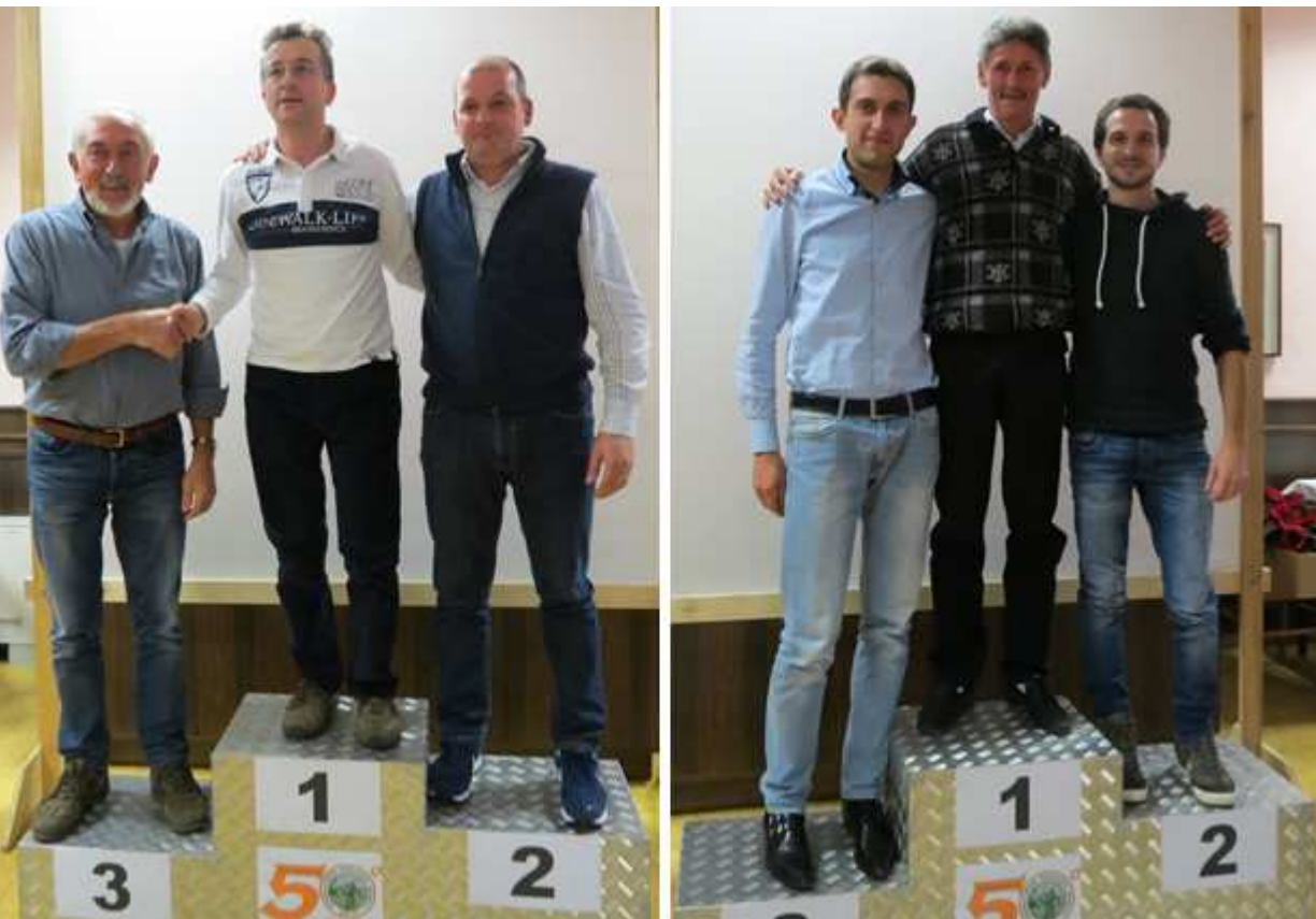
Il podio dei promossi in serie A e a destra quello relativo al campionato sociale 2014