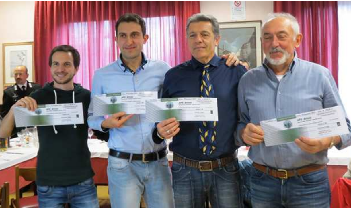
La squadra campione provinciale

Via Carlo Baslini 5 Merate (Lc) Tel. 039 990.28.81 Fax. 039 990.28.83 P. Iva 02533410136